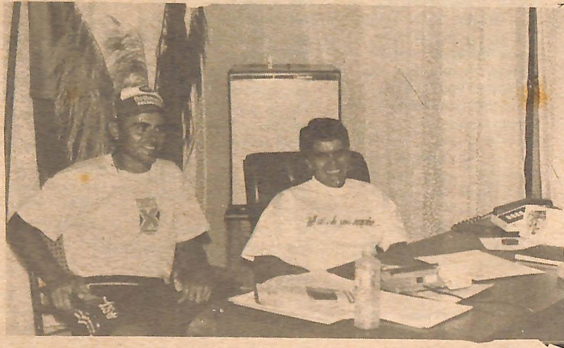
REUNIÃO COM A IMPRENSA...

Dentre as principais atividades que pretende desenvolver este ano estão: - Trabalho com escolas; - Apoio técnico às escolas municipais; - Apoio técnico e financeiro às esco-