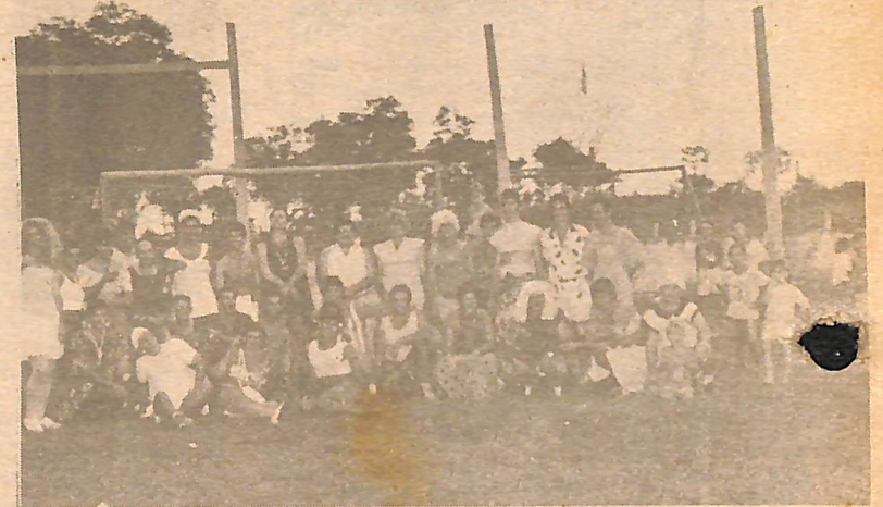
ELAS X ELAS/92 COMPROMISSO COM O ESPORTE

VEM AÍ O CARNAVAL! E CARNAVAL TEM: ELAS X ELAS