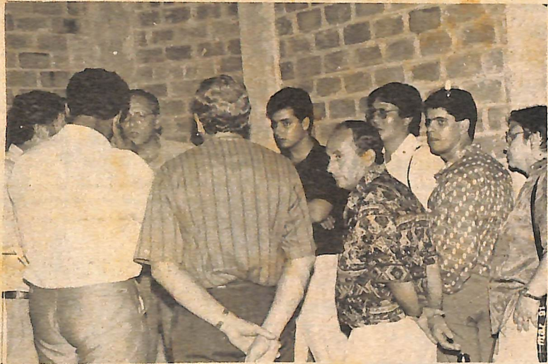
Nem os vereadores conseguiram falar com o Ministro.