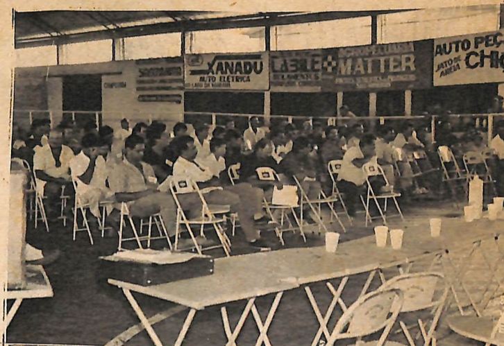
Os associados participam, discutem e decidem.

6-Trabalho profundo pelo departamento técnico, na conscientização do associado para a diversificação nas quantidades e na qualidade de maneira que o mercado de demanda seja equili-