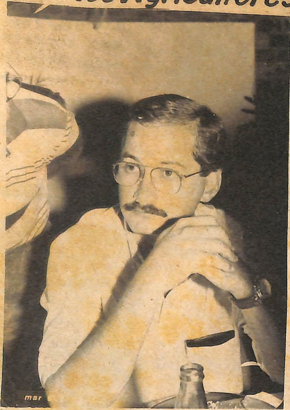
O Ministro Cabreira ouve com atenção as reivindicações dos produtores rurais.

A idéia é combinar plantio com criação de suínos em sistema de confinamento e engorda de bovinos em confinamento.