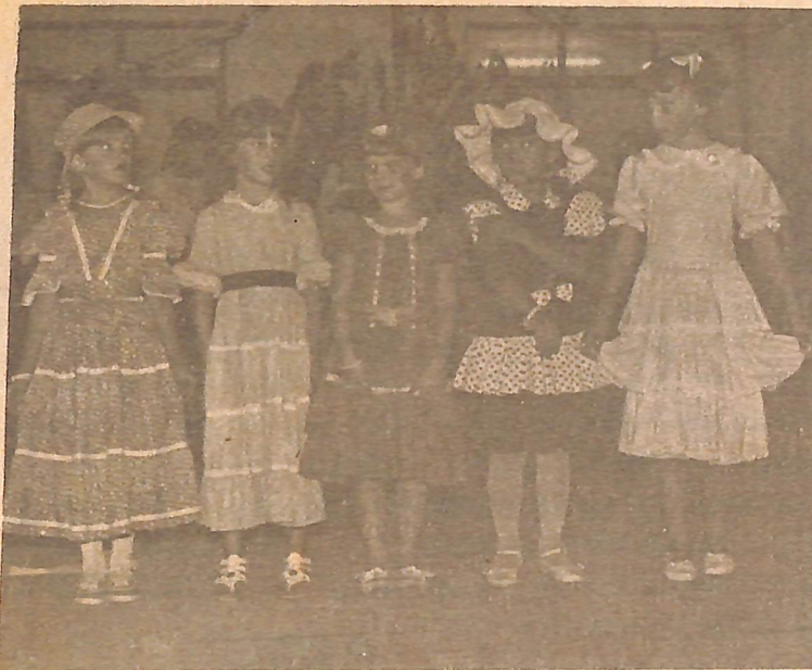
Aqui, as "Cinhazinhas" da Escola "Dom Bosco".