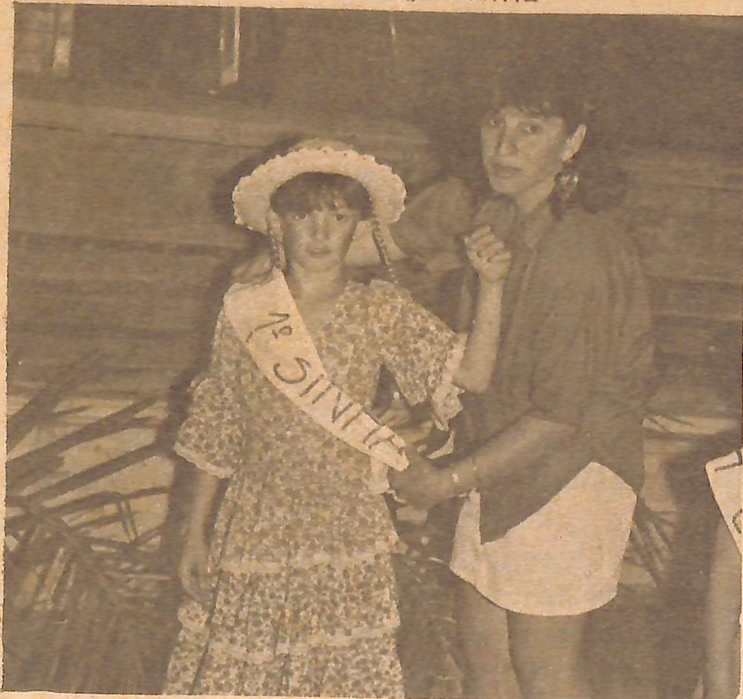
Você está vendo aí a "Cinhazinha" da Escola Eça de Queiroz, da Cidade Nova.