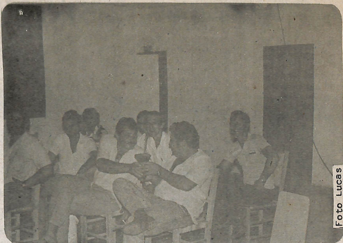
Uns riem, outros choram, outros testam sua elegância, enquanto outros, ainda, trocam gentilezas...

A intenção das lideranças partidárias do PMDB a nível de região, principalmente entre os municípios recém criados é a de unir forças e realizar um tra-